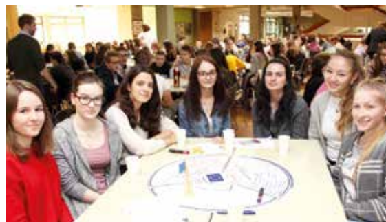
Die Jugend – hier bei der EU-Zukunftswerkstatt in Hartberg – will zu 90 Prozent an der Europawahl am 26. Mai teilnehmen und mitbestimmen.

In Österreich sind Jugendliche seit 2007 ab 16 Jahren wahlberechtigt. Die Veranstaltungsserie zeigt, dass sich Schülerinnen und Schüler durchaus intensiv mit Europapolitik beschäftigen. Als Pluspunkte sehen sie etwa Reisefreiheit, Austauschprogramme und den Euro, als „Minus“ vor allem den Brexit und Streitereien beim Thema Migration. Der „allerwichtigste Punkt“ ist, wie eine junge Teilnehmerin in Hartberg klar ausdrückte: „Wir müssen unsere Chancen nützen und wählen gehen, damit wir mitbestimmen können!“